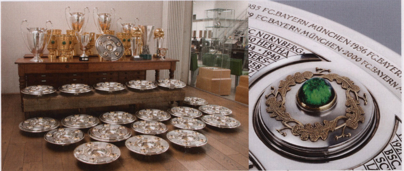
Was für eine Trophäensammlung: Hier sehen sie bis auf die Viktoria alle für die FC Bayern Erlebniswelt produzierten Pokale und Schalen, die in der Ausstellung die großen Triumphe des Klubs glänzend bezeugen.

45 POKALE UND SCHALEN DEMONSTRIEREN IN DER FC BAYERN ERLEBNISWELT DIE VORMACHTSTELLUNG IM DEUTSCHEN FUSSBALL AUF WIRKLICH GLÄNZENDE WEISE